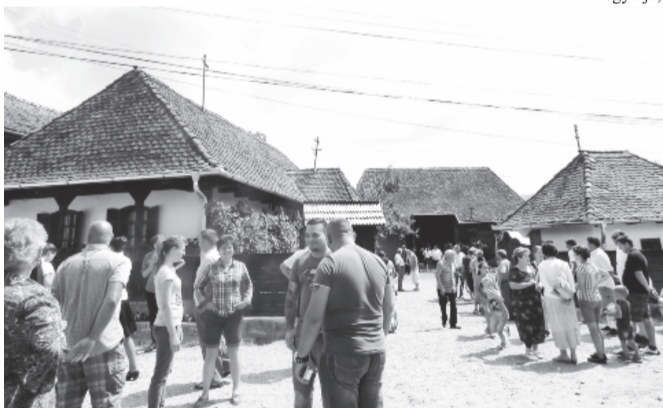
Idén a falumúzeumhoz várják a sóváradiakat és a vendégeket

Vasárnap a sportbarátok hagyományos találkozójára kerül sor. Ezt 11 órától istentisztelettel nyitják meg, majd a temetőben megkoszorúzzák egy elhunyt sportbarát sírját, a díszebédet követően pedig a sportpályán folytatódik a szórakoztató és szabadidős programok számos sportvetélkedővel, mint fiatalok-öregfiúk focimérkőzés, veresenyfutás, kötélhúzás, asztalitenisz. Ezzel párhuzamosan az érdeklődőknek kirándulást szerveznek a Bekecsre.