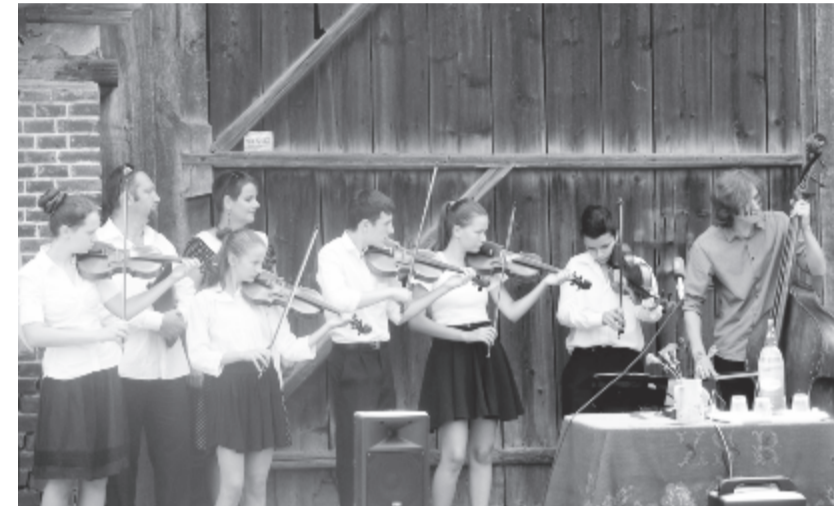
A helyi Ácsi zenekart itthon még kevesen ismerik

Rengeteg paraszti tevékenységet bemutatató programot is terveznek szombatra, bemutatják például a kenyérsütést, lekvárfőzést, csuhéfontást, kukoricaféjtést, a „díszebédet” is itt fogják felszolgálni „svédasztalos” formában: ki-ki bekapcsolódhat a kenyérdagasztásba vagy a lekvárkavarogatásba, ebédkor pedig megkóstolhatja, elfogyaszthatja a kész ter-